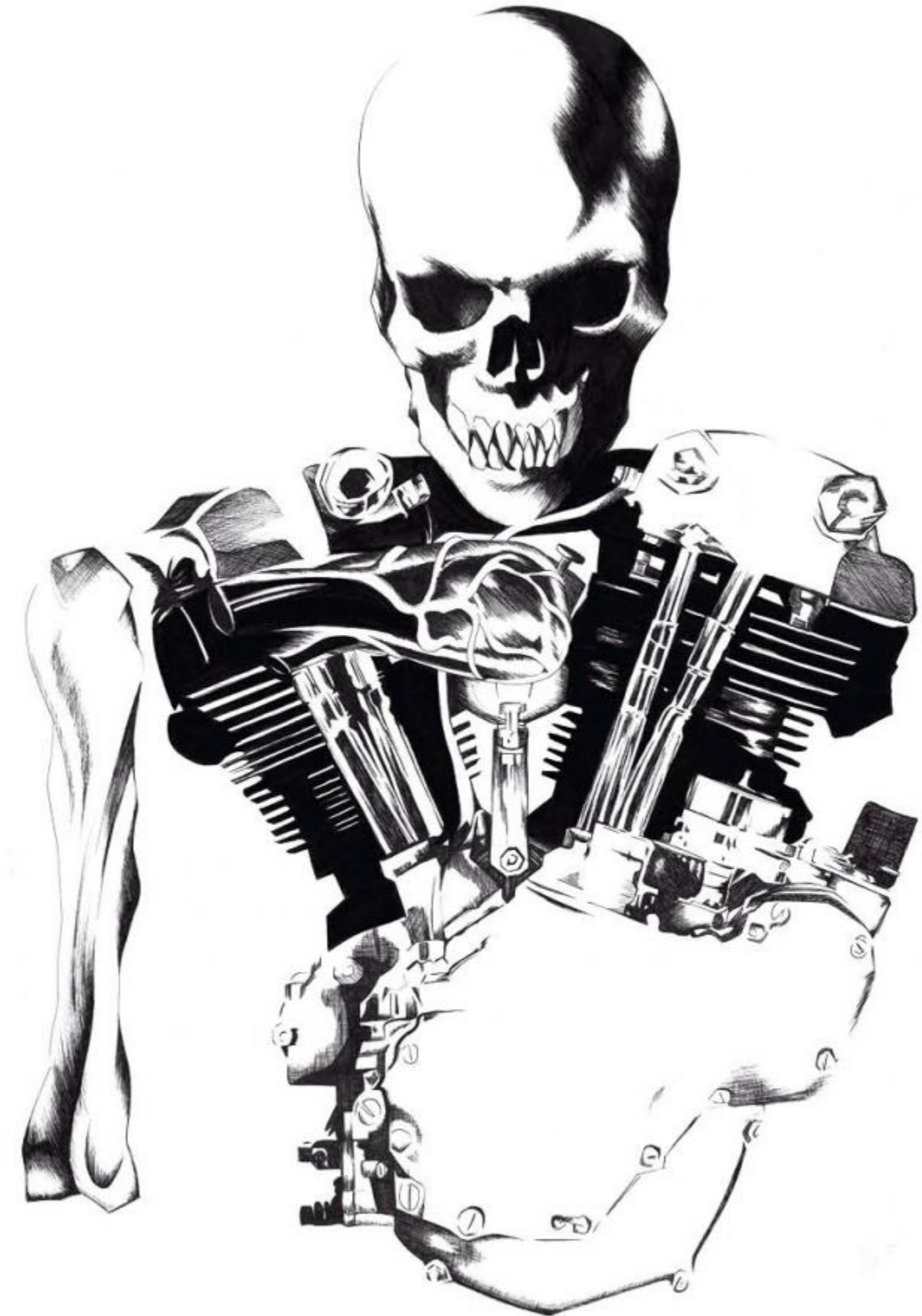
FINELINER-ZEICHNUNG AUS DEM JAHR 2016. UNTITLED.

Ich hatte lange Zeit Probleme damit, Maschinen zu zeichnen, bis mich Evangelion dazu inspirierte, mich selbst an roboterähnlichen Wesen zu probieren.