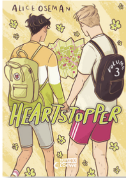
Heartstopper Volume 3 (deutsche Ausgabe)