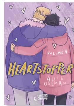
Heartstopper Volume 4 (deutsche Hardcover-Ausgabe)