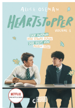
Heartstopper Volume 1