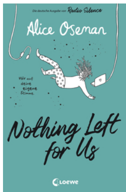
Nothing Left for Us