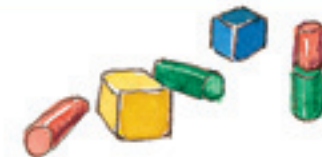
die Bauklötze кубики