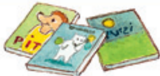
die Bücher книги