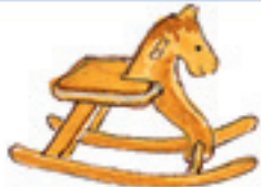
das Schaukelpferd коляска-гойдалка