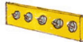
die Garderobe вішалка