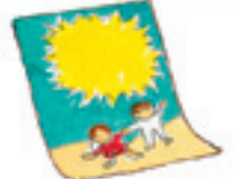
das Poster плакат